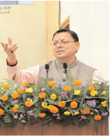
पथ प्रवाह, देहरादून

उत्तराखंड के मुख्यमंत्री पुष्कर सिंह धामी ने शनिवार को मुख्य सेवक सदन में आयोजित उत्तराखंड चिकित्सा स्वास्थ्य सशक्तिकरण अभियान कार्यक्रम के तहत 220 नव नियुक्त चिकित्सा अधिकारियों को नियुक्ति पत्र सौंपे। इस मौके पर मुख्यमंत्री ने चिकित्सकों को शुभकामनाएं देते हुए उन्हें सेवा, समर्पण और मधुर व्यवहार का मूल मंत्र दिया।