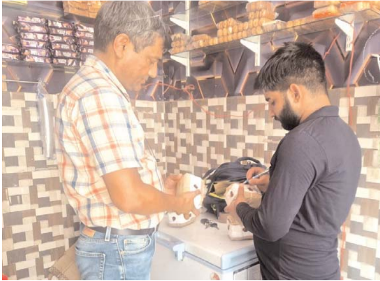
निरीक्षण के दौरान तीन खाद्य कारोबारियों को खाद्य सुरक्षा एवं मानक अधिनियम-2006